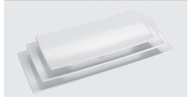
Haushaltsartikel aus Melamin-Kunststoffen